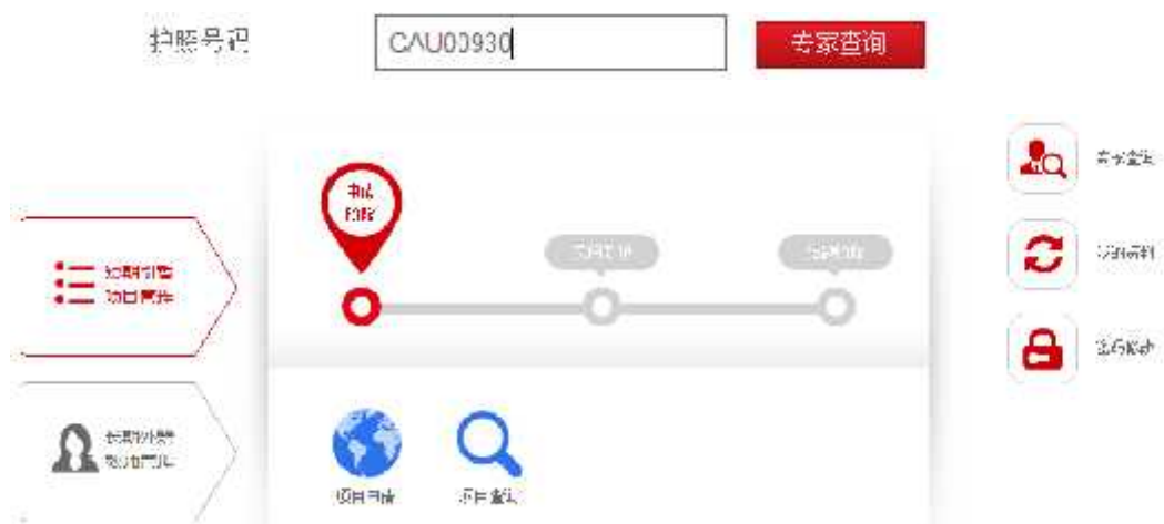
图 1：短期引智项目管理子系统界面

4、在项目中添加拟聘专家信息时，护照号码不是必填项，如果一位专家需要多次来访，必须填写该专家护照号码，点击后面的 专家查询 按钮即可提取该专家已经填写的信息，避免重复填写。